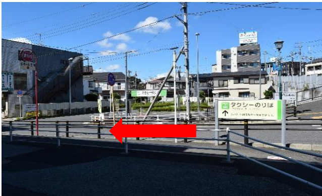
①JR市川大野駅を出て左へ進む