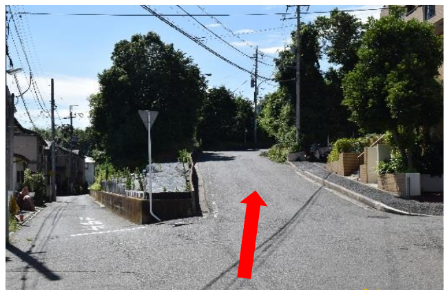
④右の道へ進む(間違いやすいので 注意 )