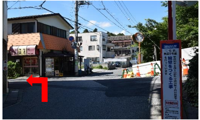
②十字路を左へ進む