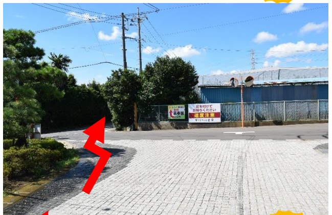
⑥ のごとく進む(間違いやすいので 注意 )