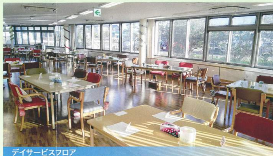
デイサービスフロア

職員構成/施設長、看護職員(看護師)、機能訓練指導員(理学療法士、作業療法士、柔道整復師)、介護職員(介護福祉士、介護職員初任者研修等)、介護支援専門員、生活相談員、管理栄養士、調理師、事務員、その他。