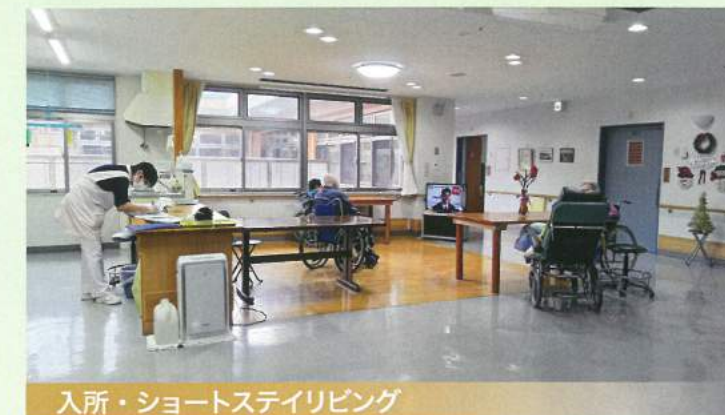
入所・ショートステイリビング