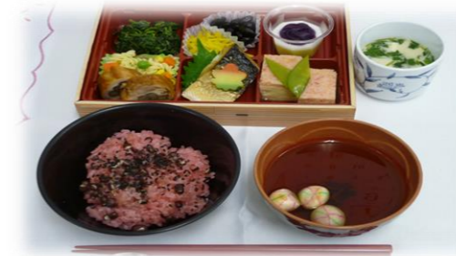
敬老の祝い膳です