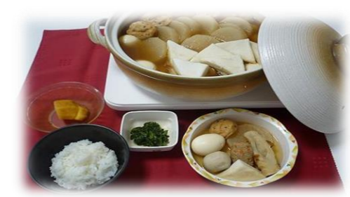
寒い時期、人気のおでんです