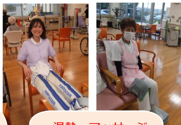
温熱・マッサージ