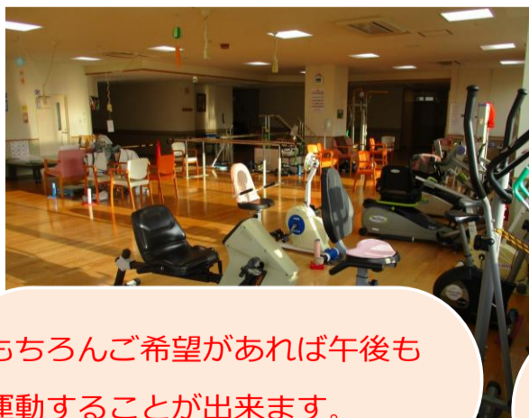
もちろんご希望があれば午後も運動することができます。