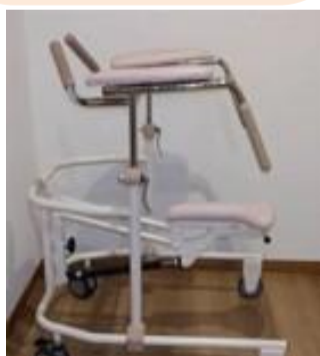
この歩行車があれば安全に一人でも歩行練習ができます。