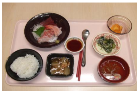
クリスマスに提供された昼食とデザート