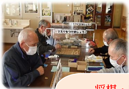
将棋・囲碁 名人戦