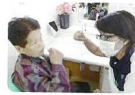
▲口腔機能向上活動