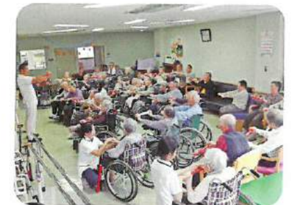
▲集団体操・レクリエーション