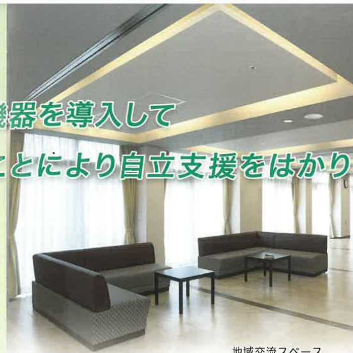
地域交流スペース