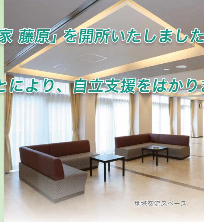
地域交流スペース