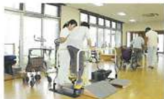
■機能訓練(リハビリ)

介護保険の要介護3～5に認定されている方で、 常時介護が必要であり、かつ在宅での生活が困難な方