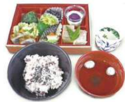
健康な体は毎日の美味しい食事から