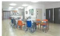
■各ユニット共通スペース