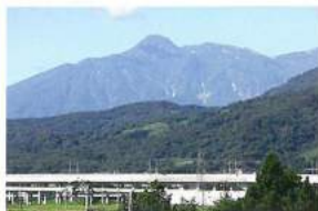
当施設から見える妙高山