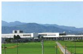
当施設から見える北陸新幹線「上越妙高」駅