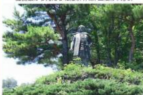
上杉謙信像（春日山城跡）

関連施設 社会福祉法人 松涛会 〒942-1342 新潟県十日町市浦田2955-1